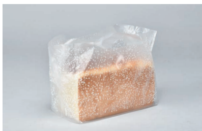
キャリーバッグNo.46 かすみ草 食パン2斤