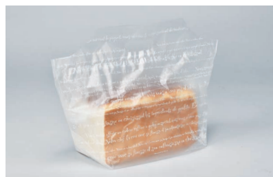
フラットバッグS フランス 食パン2斤