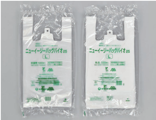
舌片付ブロックタイプ