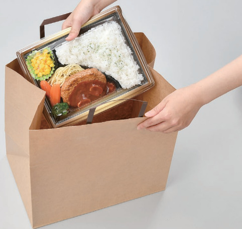
No.32-31.5 未晒無地 BH