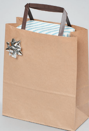
No.20-23.5 未晒無地 BH