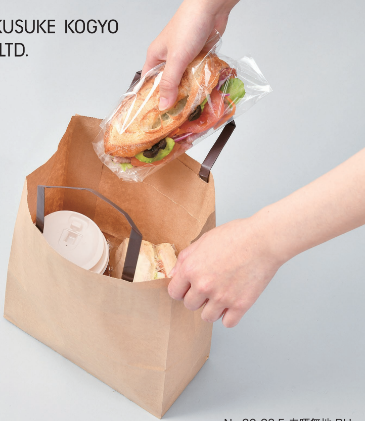
No.20-23.5 未晒無地 BH