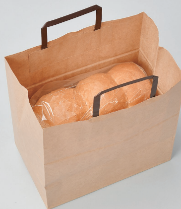
No.26-27 未晒無地 BH