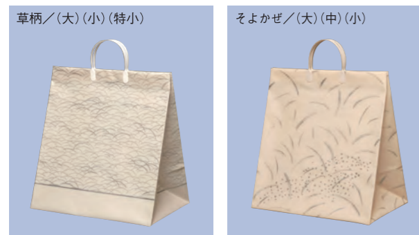
草柄／(大)(小)(特小) (大)H450×W400×マチ270(mm) ケース入数 100枚 (小)H370×W340×マチ260(mm) ケース入数 150枚 (特小)H320×W320×マチ220(mm) ケース入数 200枚 そよかぜ／(大)(中)(小) (大)H450×W400×マチ270(mm) ケース入数 100枚 (中)H550×W400×マチ200(mm) ケース入数 100枚 (小)H370×W340×マチ260(mm) ケース入数 150枚

別注品 ●最低ロット: 3,000枚 (グラビア印刷両面合計 5色刷迄) : 5,000枚 (グラビア印刷両面合計 10色刷迄) ●版代・版下代: 別途見積りいたします。