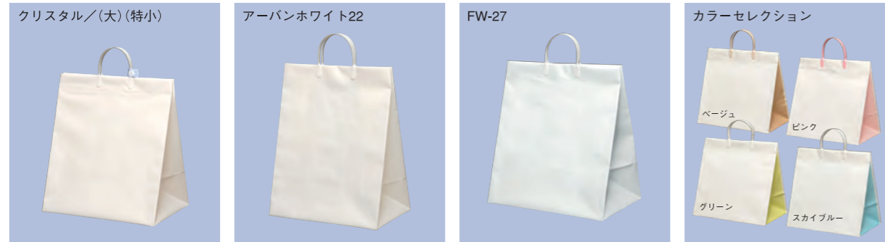
クリスタル／(大)(特小) (大)H450×W400×マチ270(mm) ケース入数 100枚 (特小)H320×W320×マチ220(mm) ケース入数 200枚 アーバンホワイト22 H450×W350×マチ220(mm) ケース入数 150枚 FW-27 H450×W400×マチ270(mm) ケース入数 150枚 カラーセクション H350×W350×マチ220(mm) ケース入数 100枚 ベージュ、ピンク、グリーン、スカイブルー