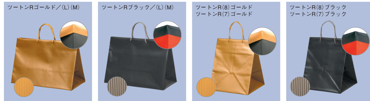
ツートンRゴールド／(L)(M) (L)H300×W420×マチ200(mm) ケース入数 100枚 (M)H270×W360×マチ150(mm) ケース入数 200枚 ツートンRブラック／(L)(M) (L)H300×W420×マチ200(mm) ケース入数 100枚 (M)H270×W360×マチ150(mm) ケース入数 200枚 ツートンR(8)ゴールド ツートンR(7)ゴールド (8)H350×W285×マチ265(mm) ケース入数 200枚 (7)H300×W235×マチ215(mm) ケース入数 200枚 ツートンR(8)ブラック ツートンR(7)ブラック (8)H350×W285×マチ265(mm) ケース入数 200枚 (7)H300×W235×マチ215(mm) ケース入数 200枚