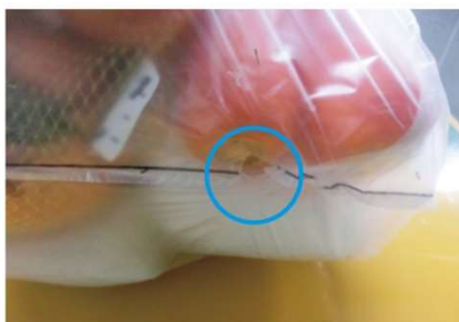
マチ部分に穴が開きやすい