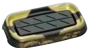
みまつきん 美松金