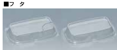
フタ 透明外嵌合Fフタ ※但し、フタの醤油受けは 9H・10H・10H-B・12H のみです。