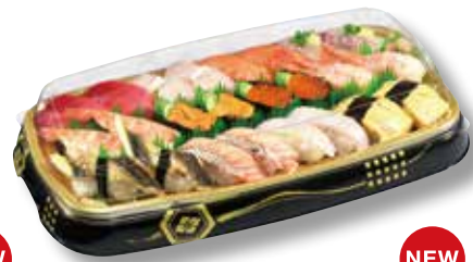
舞台桶24H 天守 (378×202×36mm)