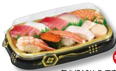
舞台桶10H-B 天守 (262×154×33mm)

底面には、豪快に金を使用し、袴の柄は、金を控えめにすることで中身を更に引き立たせます。