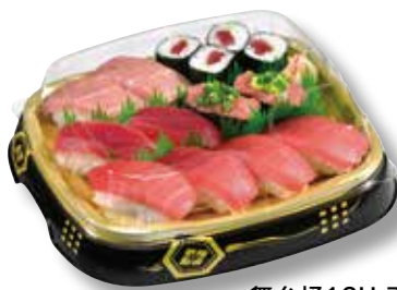
舞台桶12H 天守 (228×200×33mm)